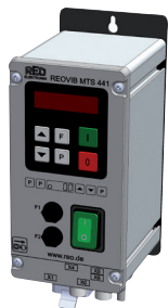
REOVIB MTS 441 IP54