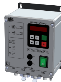
REOVIB MTS 442 IP54